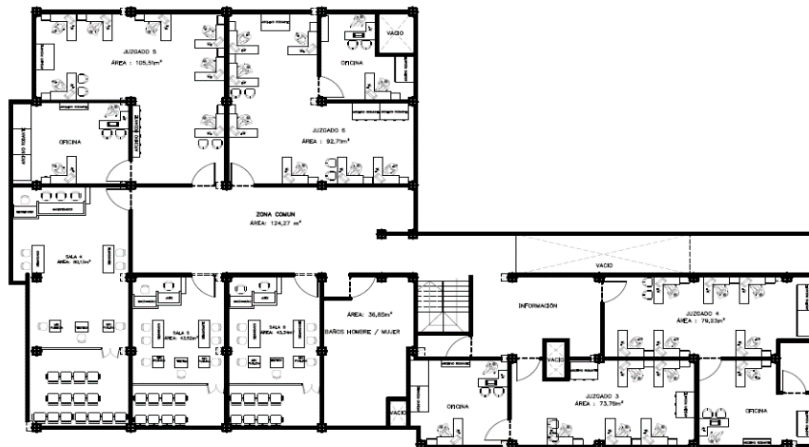
PLANTA ARQUITECTÓNICA – BODEGA SEGUNDO PISO.

El inmueble se encuentra dentro de un precio justificado; con mayor área y mejor precio; igualmente, el propietario ha realizado adecuaciones al inmueble según los requerimientos de la entidad, lo que hace que sea la mejor opción y oferta para arrendar en estos momentos.