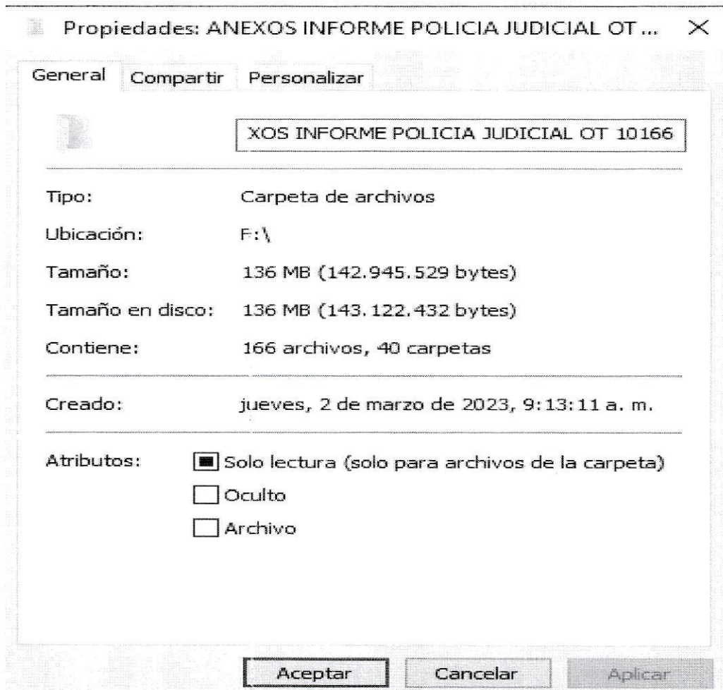
IMAGEN 11

Se hace salvedad que tanto el informe como CD con los anexos, se allegan al Despacho de su Señoría en medio físico.