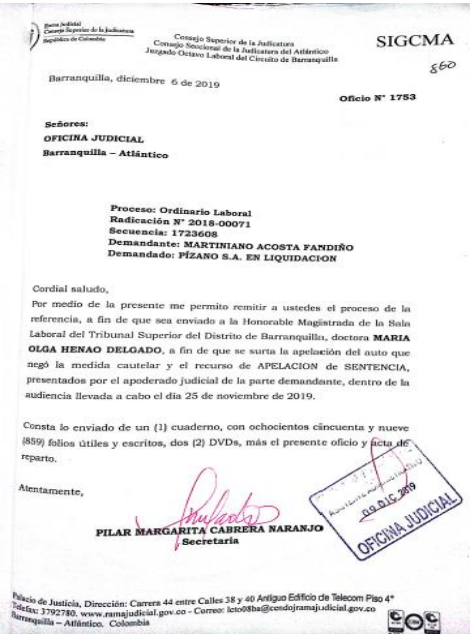
ImagenCitadaExpedientefico860 y 864.

Ahora bien; en atención a lo aducido en el informe secretarial, se pudo observar que no existe otra copia de las citadas audiencias, y/o documentales solicitadas por el órgano superior, ya que los CDs originales, son las que reposaban en el expediente físico, enviado el seis (6) de diciembre del 2019, mediante oficio 1753, Para que se surtiera recurso apelación de sentencia.