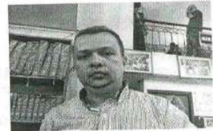
----- Fotografía -----

De acuerdo con la Resolución 5633 de 2016 de la Registraduría Nacional del Estado Civil - RNEC y el Artículo 18 del Decreto - Ley 019 de 2012, el/la compareciente fue identificado(a) mediante cotejo biométrico frente a la base de datos de la RNEC, lo anterior, de conformidad con la autorización de tratamiento de datos personales otorgada por el/la compareciente.