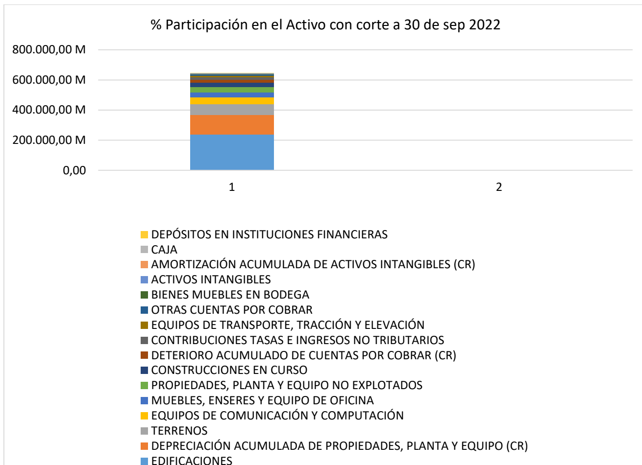
Grafico. Grafica Detalle Contable Cuentas del Activo