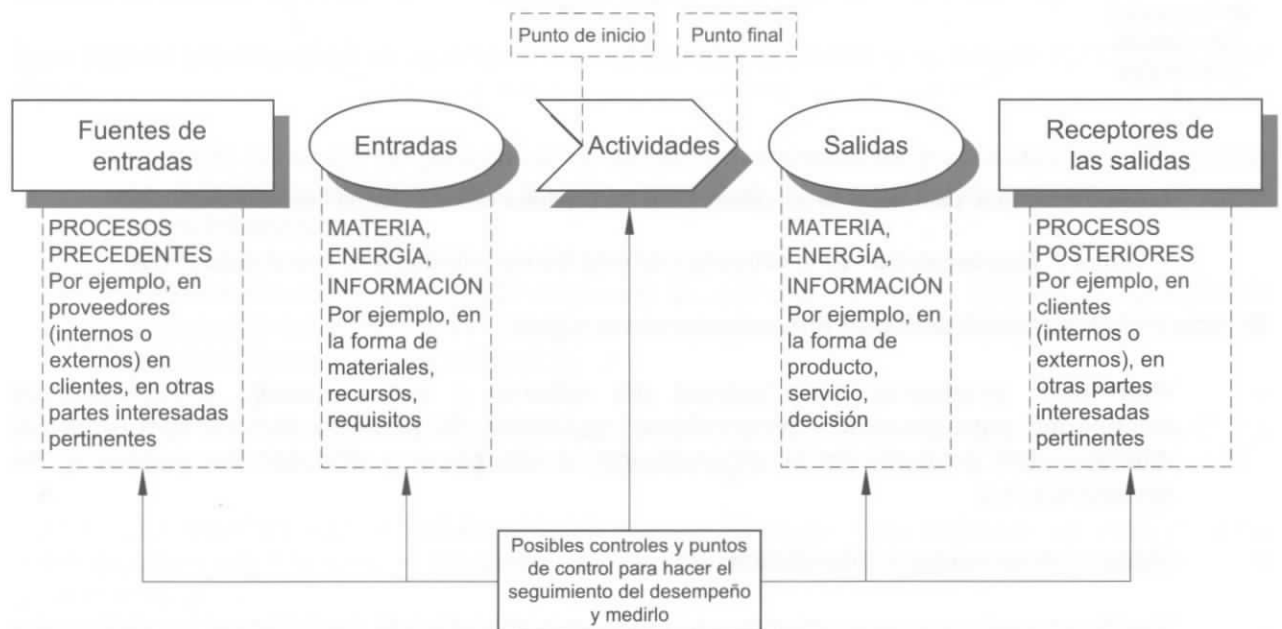
Figura 1. Representación esquemática de los elementos de un proceso

La Figura 1 proporciona una representación esquemática de cualquier proceso y muestra la interacción de sus elementos. Los puntos de control del seguimiento y la medición, que son necesarios para el control, son específicos para cada proceso y variarán dependiendo de los riesgos relacionados.