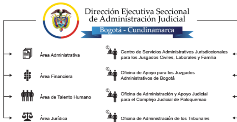
Gráfico No.1. Organigrama de la DESAJ.

La Dirección Seccional de Administración Judicial Bogotá – Cundinamarca cuenta con 245 empleados distribuidos en cuatro áreas de apoyo, un centro de servicios, una oficina de administración y dos oficinas de apoyo judicial (ver Gráfico 1)