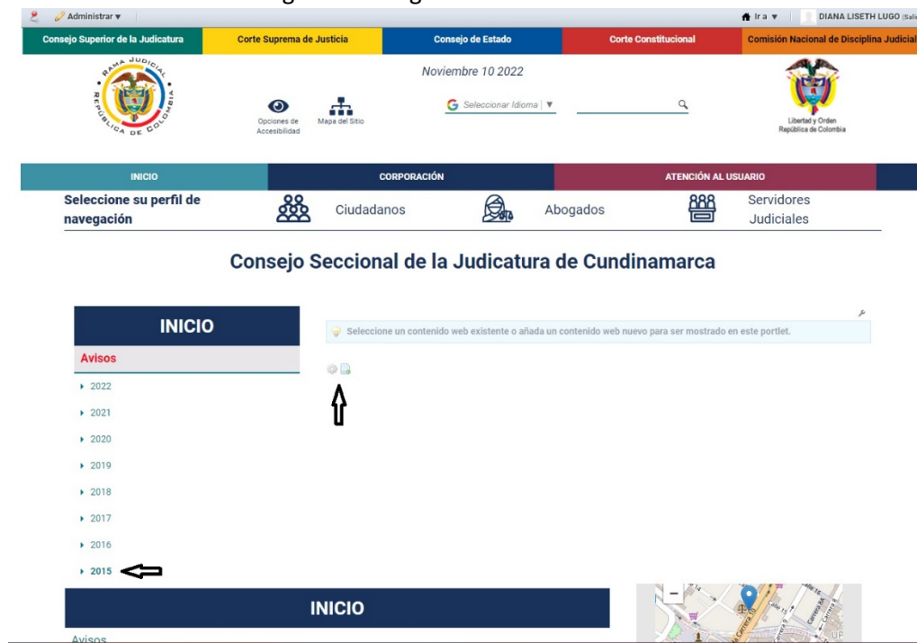
Imagen No 2.