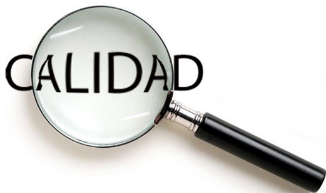
Imagen tomada en línea por este programa de diseño.

Mediante este sistema el Poder Judicial del país, como parte de la Red Iberoamericana para una Justicia de Calidad, continuará fomentando la investigación, el desarrollo y la innovación en los procesos y procedimientos administrativos y de gerencia de los Despachos Judiciales, con miras a posicionar este sistema en los ámbitos nacional e internacional, eso sí, con los más altos estándares de excelencia.