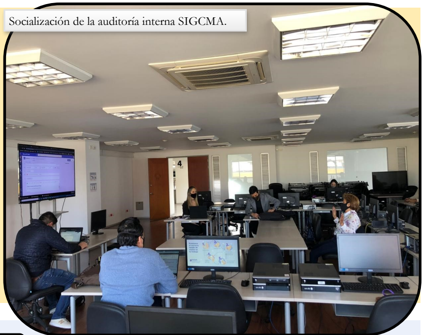
Socialización de la auditoría interna SIGCMA.

Al hablar de la política del SIGCMA, se refiere al compromiso del Consejo Superior de la Judicatura de establecer, documentar, implantar, mantener y mejorar el Sistema Integrado de Gestión y Control de la Calidad y del Medio Ambiente en todas sus dependencias, del nivel central y seccional y los despachos judiciales, conforme a las metas y objetivos establecidos para la satisfacción de los usuarios, la preservación del medio ambiente y la generación de controles efectivos.