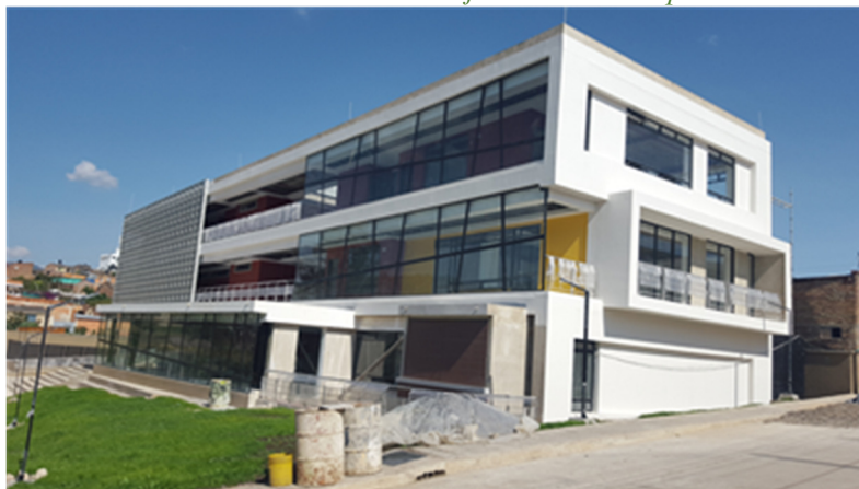
Ilustración No. 2: Sede judicial - Ramiriquí