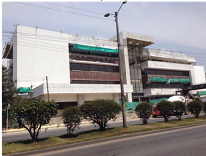
Ilustración No. 4: Sede despachos judiciales - Facatativá