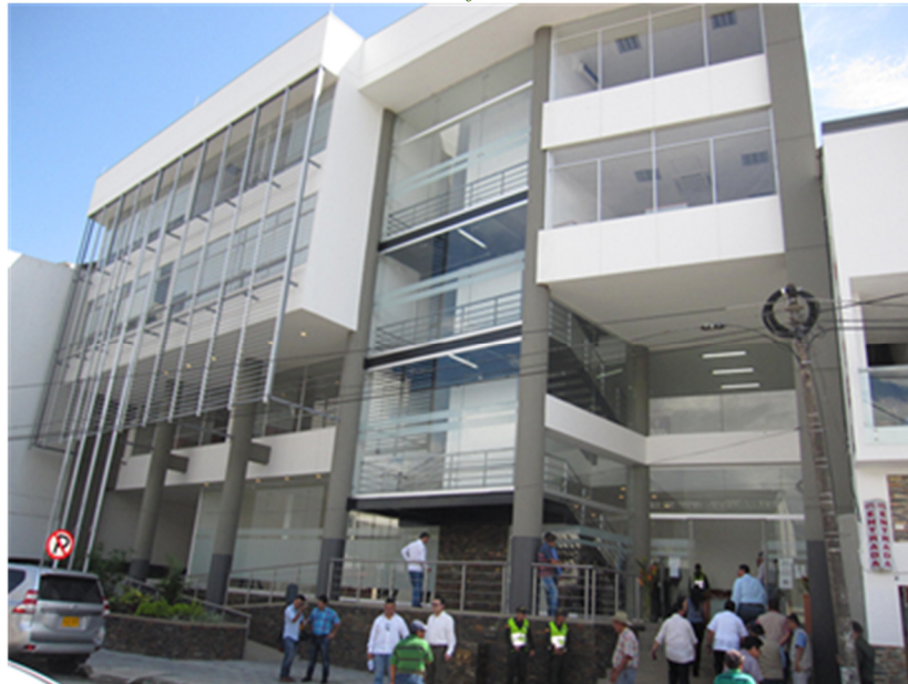
Ilustración No. 1: Sede judicial Acacías - Meta

Fuente: Unidad de Infraestructura Física – Dirección Ejecutiva de Administración Judicial