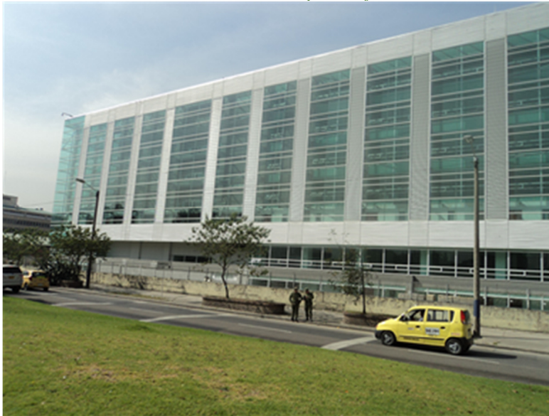
Ilustración No. 3: Sede de despachos judiciales CAN