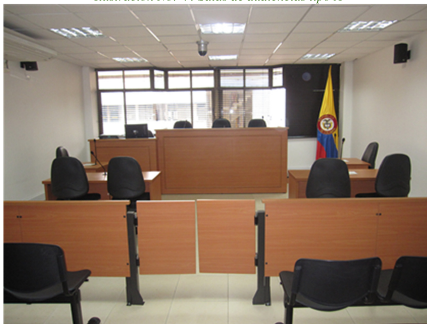
Ilustración No. 7: Salas de audiencias tipo A