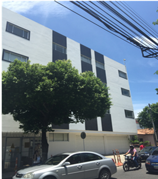
Ilustración No. 8: Sede judicial – Restitución de Tierras Cúcuta