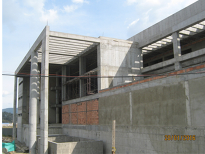
Ilustración No. 5: Sede judicial en Zipaquirá