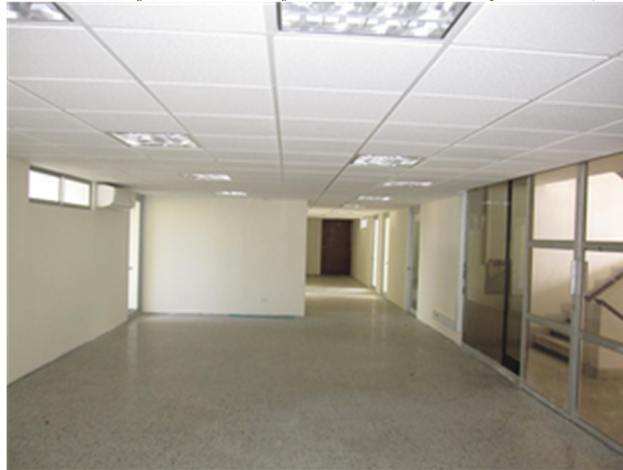
Ilustración No. 6: Sede judicial – Edificio José Acevedo y Gómez (Bucaramanga)