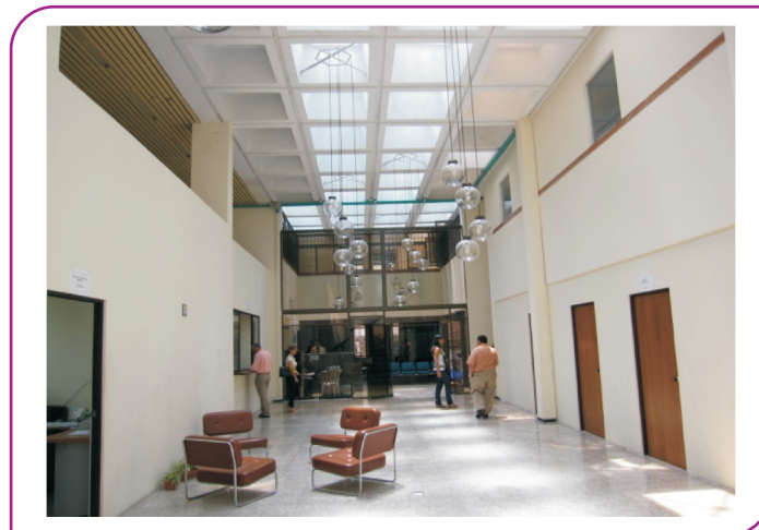
Buga Adecuaciones Sistema de Responsabilidad Penal para Adolescentes

Actualmente se encuentra en proceso de implementación la fase VI, del sistema de responsabilidad penal para adolescentes en los distritos judiciales de Pasto, Quibdó, Yopal, Arauca, Florencia, San Andrés y Villavicencio. La Sala Administrativa se encuentra desarrollando las adecuaciones de los inmuebles de las fases de implementación II a IV, así como la dotación de mobiliario para las salas de audiencias, juzgados de garantías, conocimiento y centros de servicios en las cabeceras de distrito con un avance de 27 salas de audiencias, 47 juzgados y 9 centros de servicios.