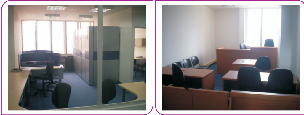
Ibagué Juzgados y salas de audiencia, oralidad laboral

En el 2009 se continuó con la adecuación de las salas de audiencias y juzgados laborales en Bogotá, Ibagué, Valledupar con la ejecución de 45 salas de audiencias y 16 juzgados laborales con una inversión de $ 6.300 millones.