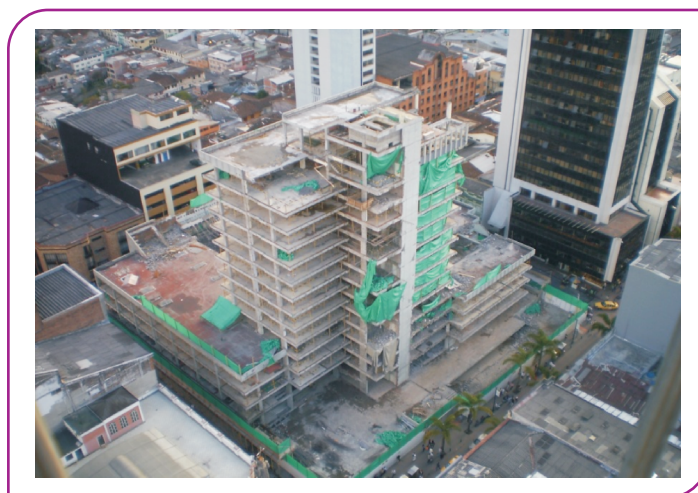
Palacio de Justicia de Manizales

De otra parte, para la intervención integral del Palacio, se gestiona la adquisición de cuatro ascensores de última generación, también de materiales para pisos y fachada.